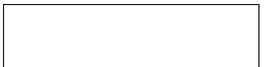
Схема границы балансовой принадлежности

е) границей эксплуатационной ответственности объектов централизованной системы холодного водоснабжения исполнителя и заявителя является: